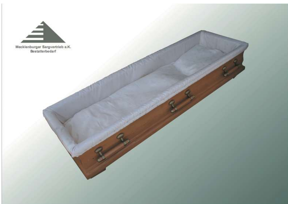
Sargausstattung in Pinselstrich 4-teilig 1814 ohne Decke und Kissen