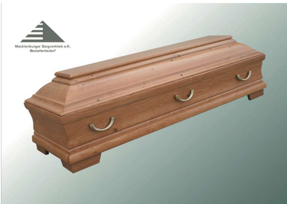
Modell 319 in Tanne lackiert Halbmondgriffe