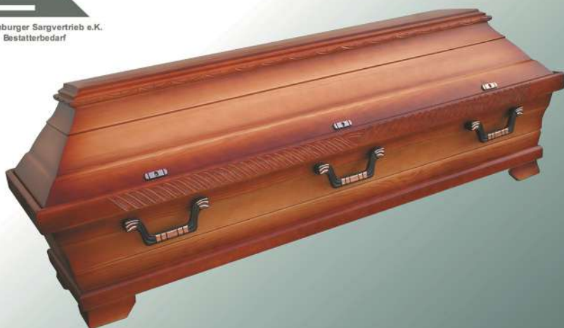
KB5 rustikal altdeutsch