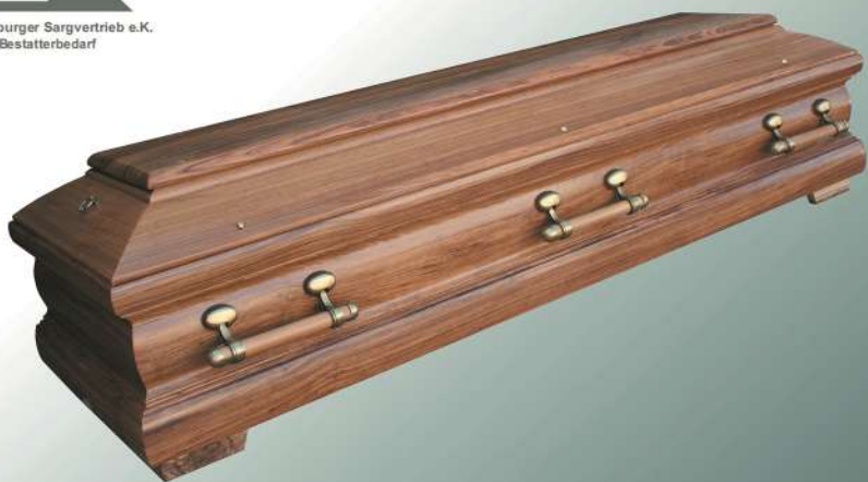
Diritto 51 Nussbaum