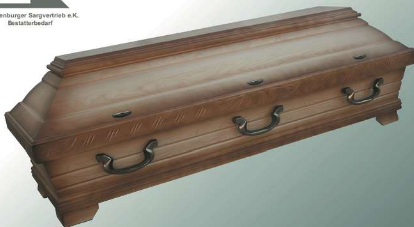
KB451 natur Patina