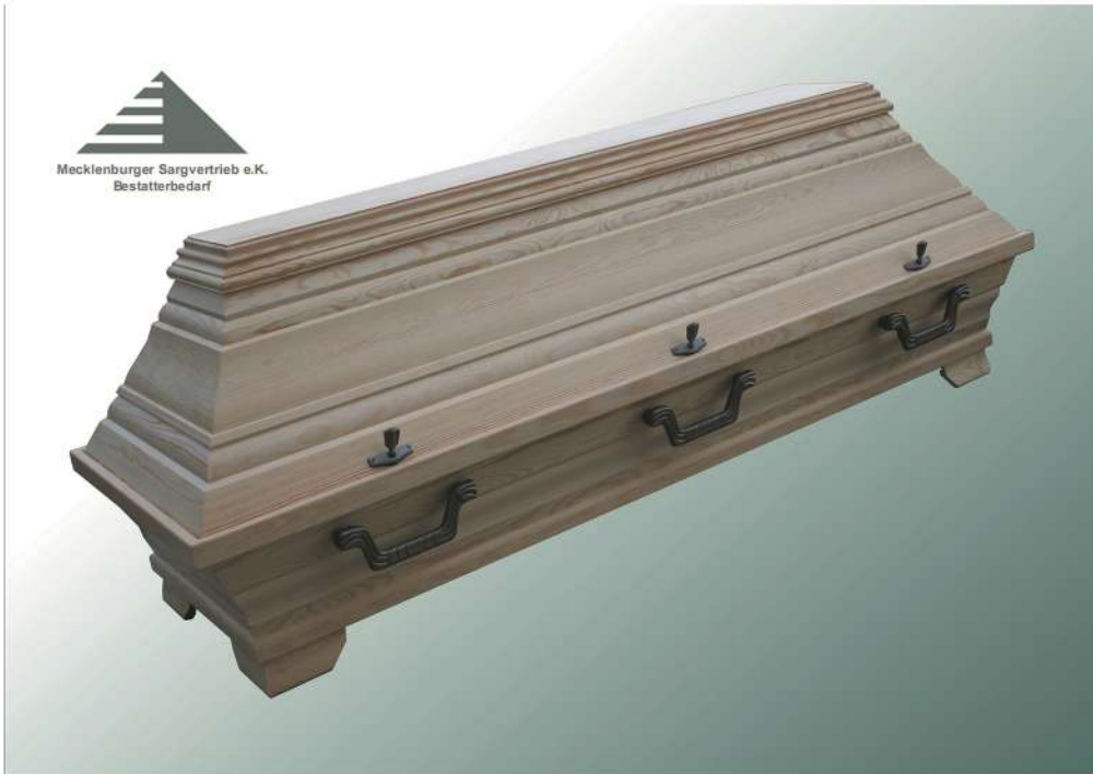
KB8 natur mit 35 Zinn