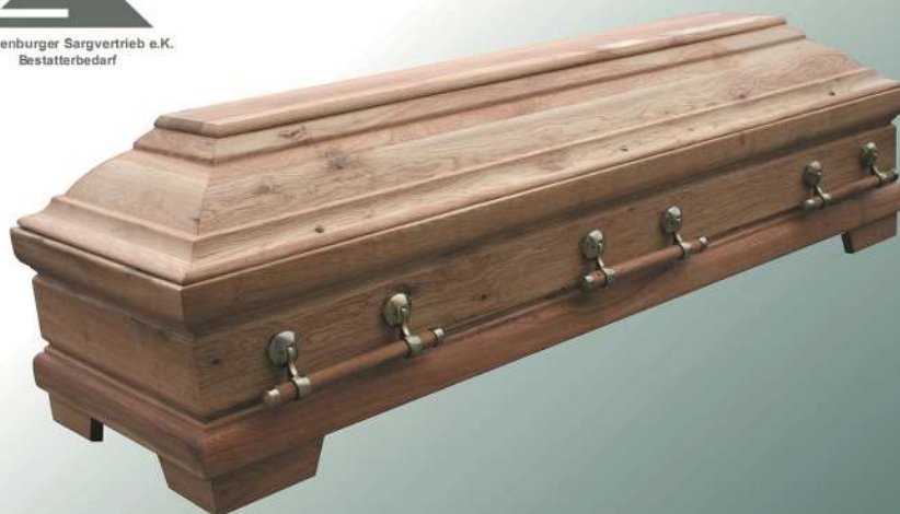
Modell 311 in Wildeiche Holzgriffe