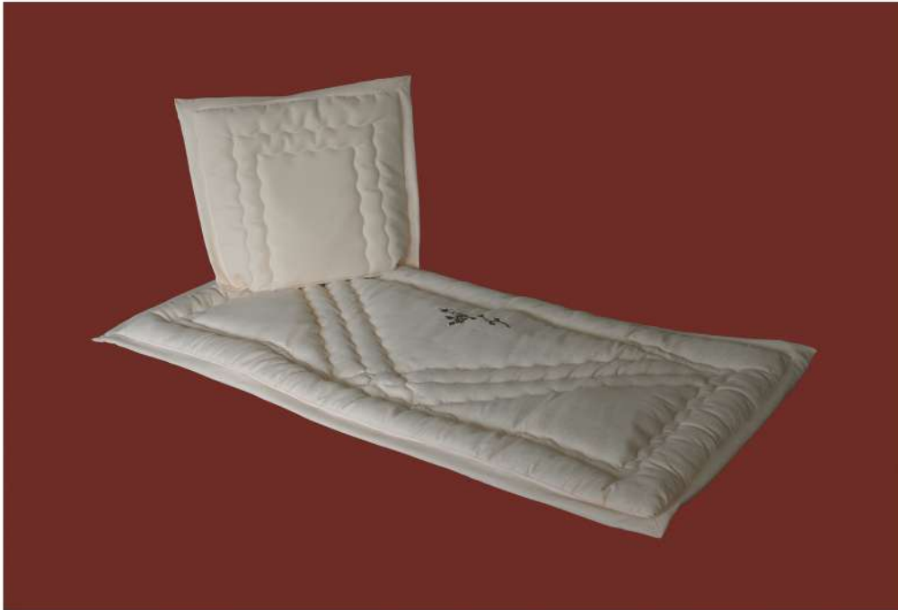
CH-1613-3AV braune Rose