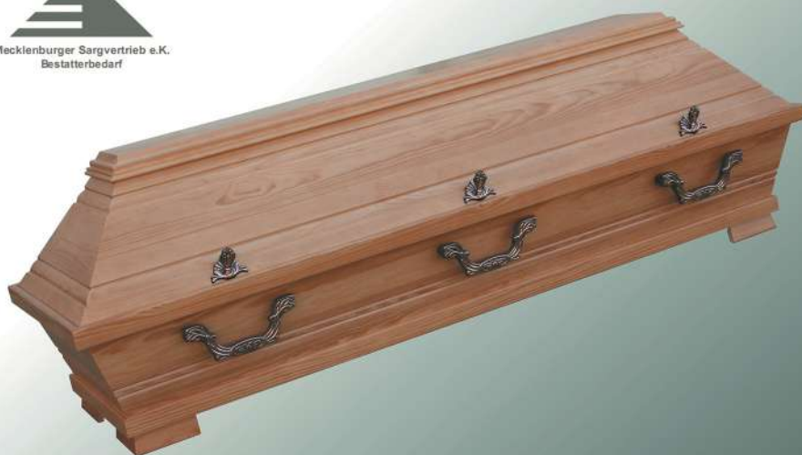
KB1 m rustikal