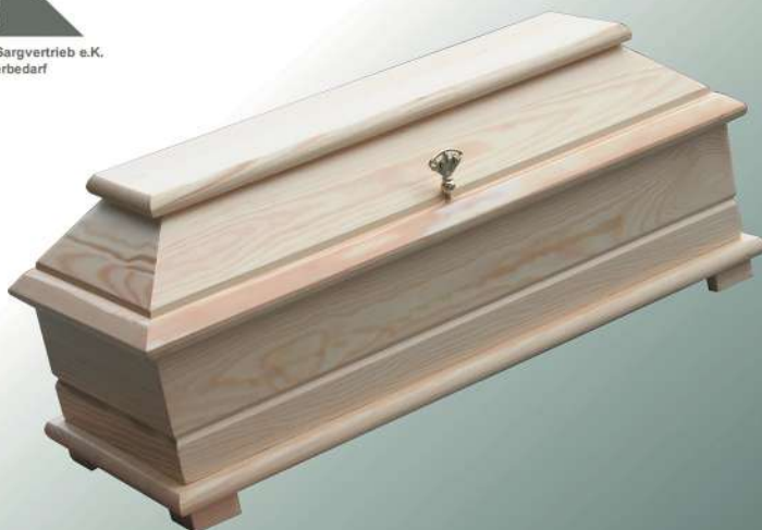
Kindersarg BKW 60 natur ohne Griffe