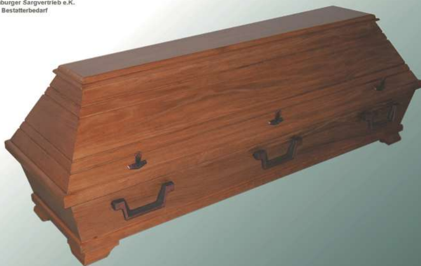
EB11 Kiefer Eiche funiert rustikal