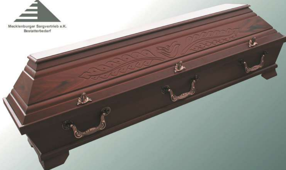
VBK2 Nussbaum Imitation Palme