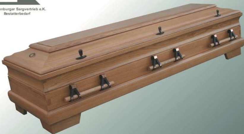
Diritto 81 Eiche mit Holzgriffen