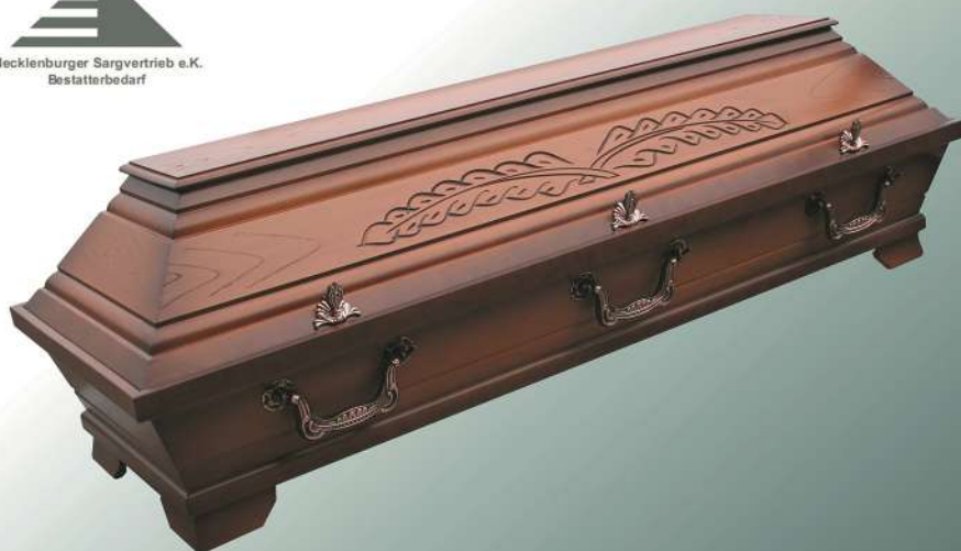
VBK2 mittel altdeutsch Palme antik