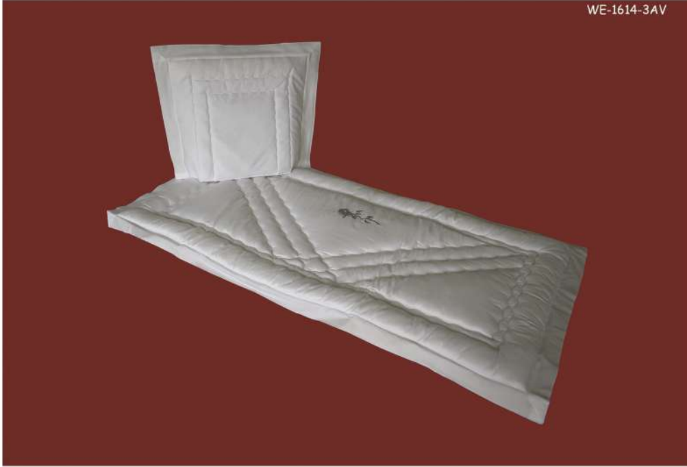
WE-1614-3AV Rose Silberkreuz