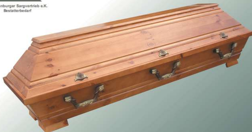
VBK2 rustikal Griffe Nr.85 Flämisch Bernstein