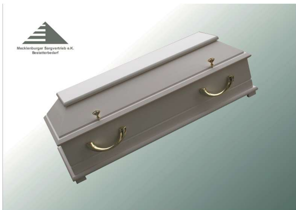
Kindersarg BKW 100 weiß mit 4 Griffe