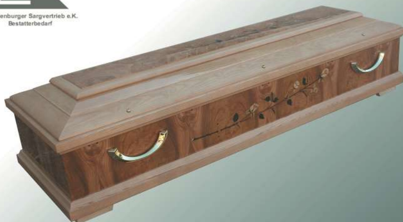
Diritto Wurzelholz mit Rosenintasie