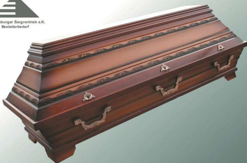
KB4 altdeutsch Stabschnitzung