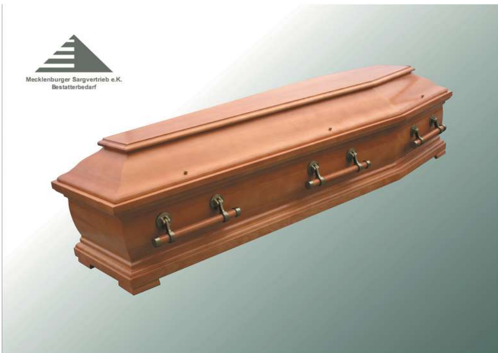
KLG 500 Piano KF