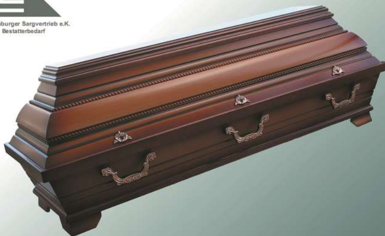
KB7 mittel altdeutsch Perlstab