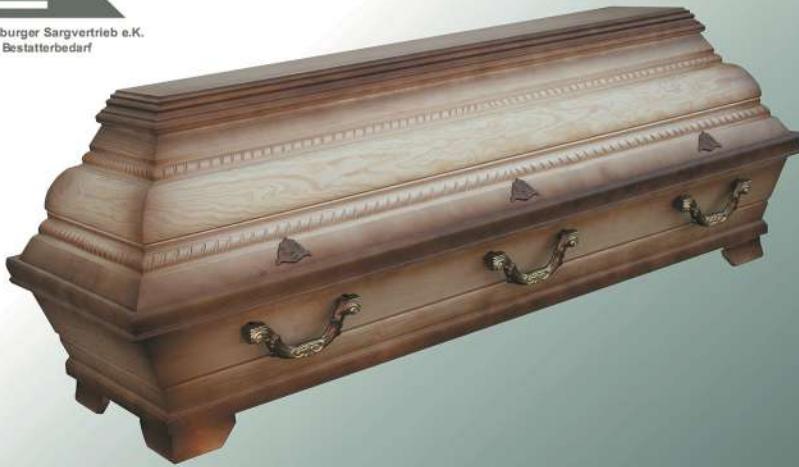
KB7a natur Patina