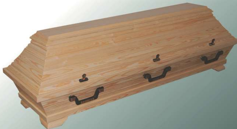
KB8 natur 35 galvanisch