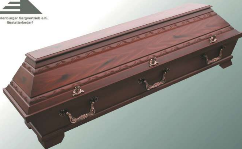
VBK2 Nussbaum Imitation Stabschnitzung