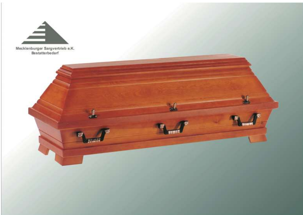
KB1 Kirsche gebeizt