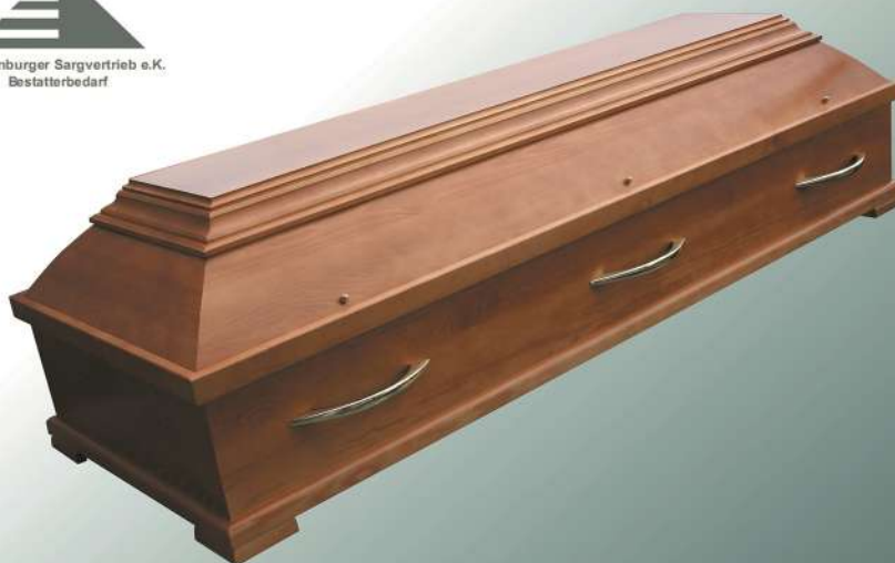
KLG Anfora Kiefer