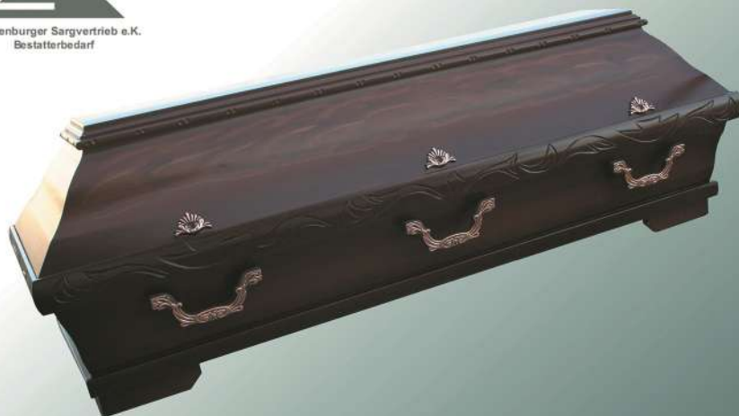
KB280 Nussbaum Imitation

Mecklenburger Sargvertrieb e.K. Bestatterbedarf