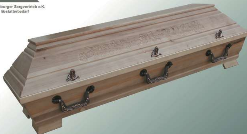
VBK2 Pappel natur Rose