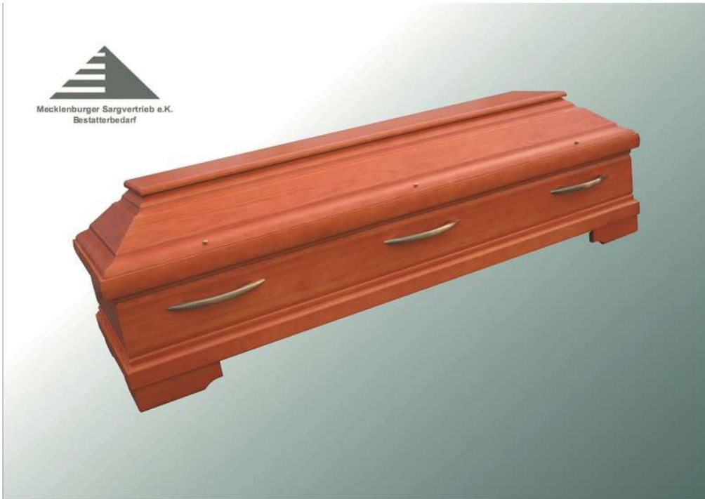
Toscana 21 Bernstein