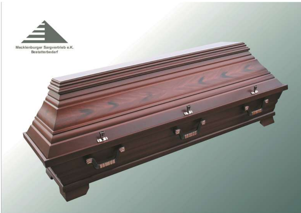
KB8 Nussbaum Imitation ohne Schnitzung