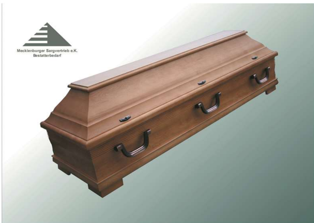
KLG 700 Kiefer rustikal