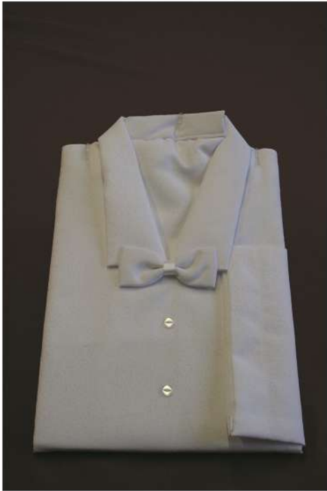
HB 33 XXL