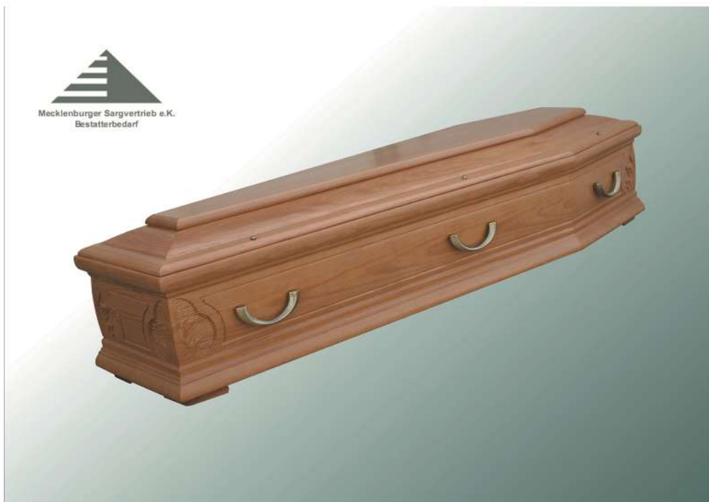
KLG Nr. 30 KF Eckschnitzung