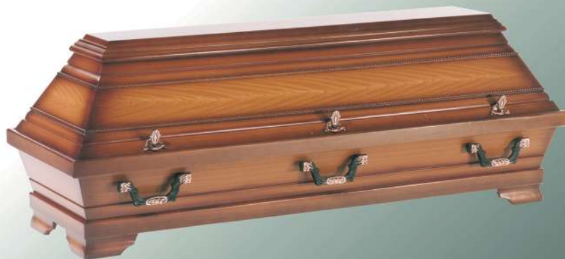
KB1 Kirsche Imitation Perlstab