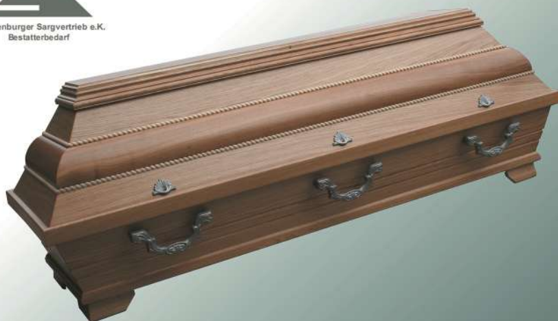
EB6 natur Wulst Perlstab

Mecklenburger Sargvertrieb e.K. Bestatterbedarf