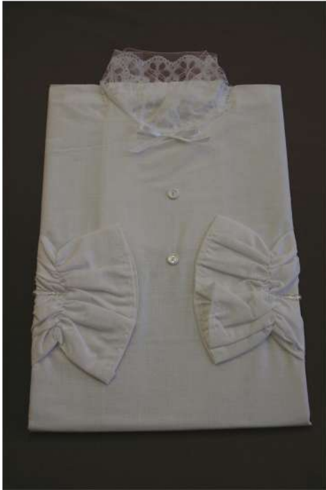
Krema DB XXL