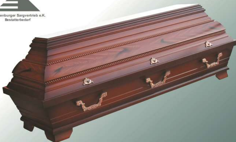
KB7 Nussbaum Imitation Perlstab