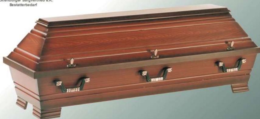
VBK5 Mahagoni Imitation