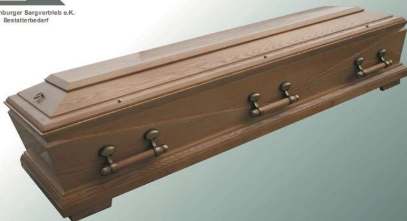
Diritto 91 Esche natur