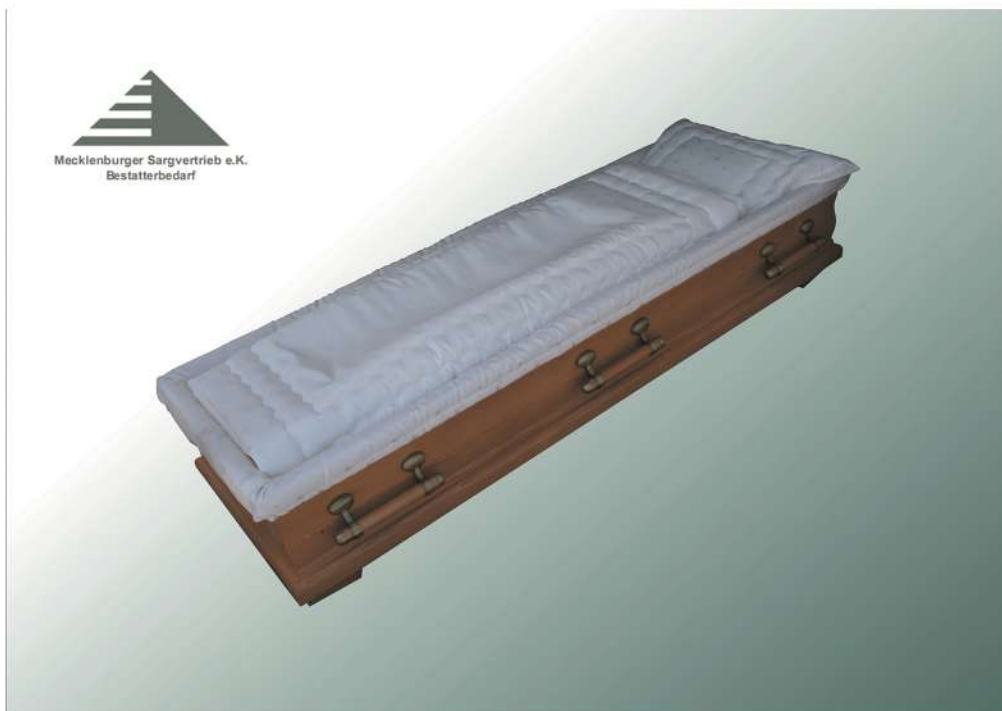
Sargausstattung in Pinselstrich 4-teilig 1814 mit Decke und Kissen