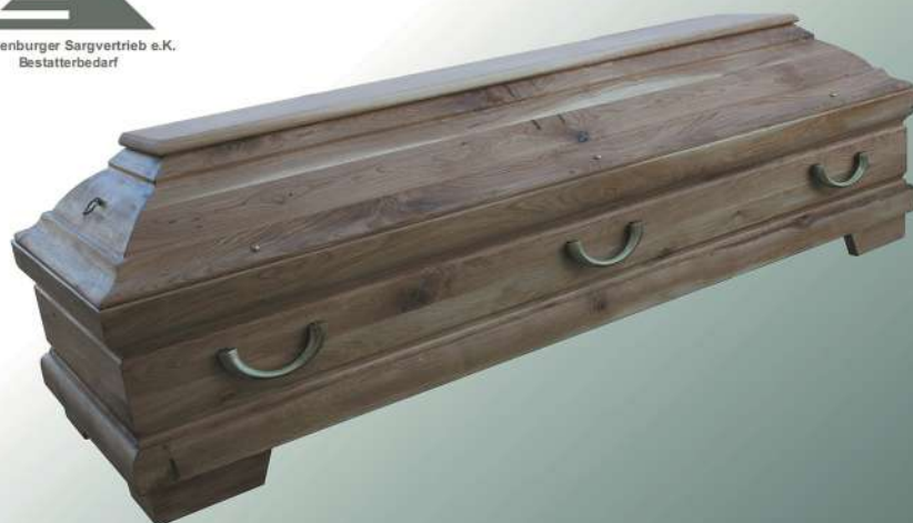
Modell 311 in Wildeiche Halbmondgriffe