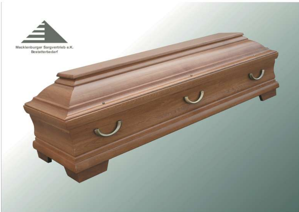
Modell 319 in Eiche lackiert Halbmondgriffe