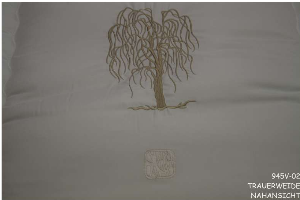
945V-02 TRAUERWEIDE NAHANSICHT