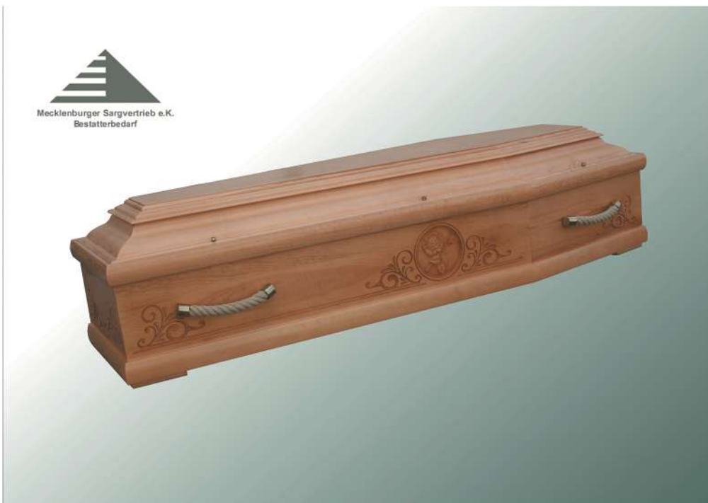
KLG Rose KF