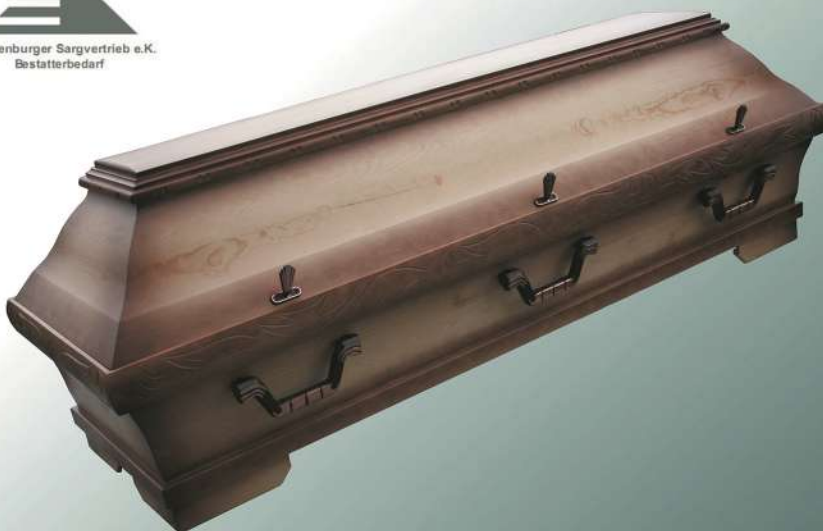
KB280 natur Patina

Mecklenburger Sargvertrieb e.K. Bestatterbedarf