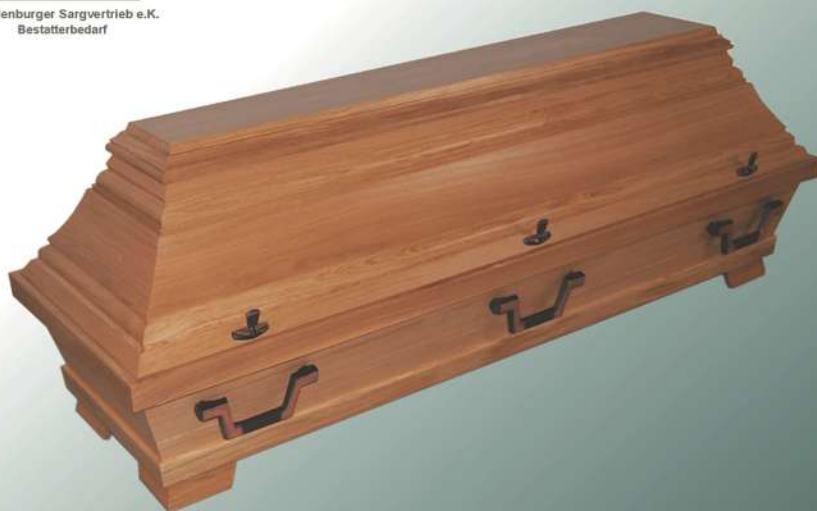
EB8 natur ohne Schnitzung