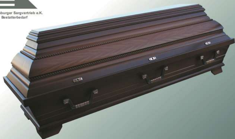
KB7 Kirschbaum Imitation Perlstab