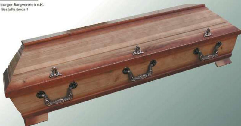
VBK2 Pappel altdeutsch ohne Schnitzung