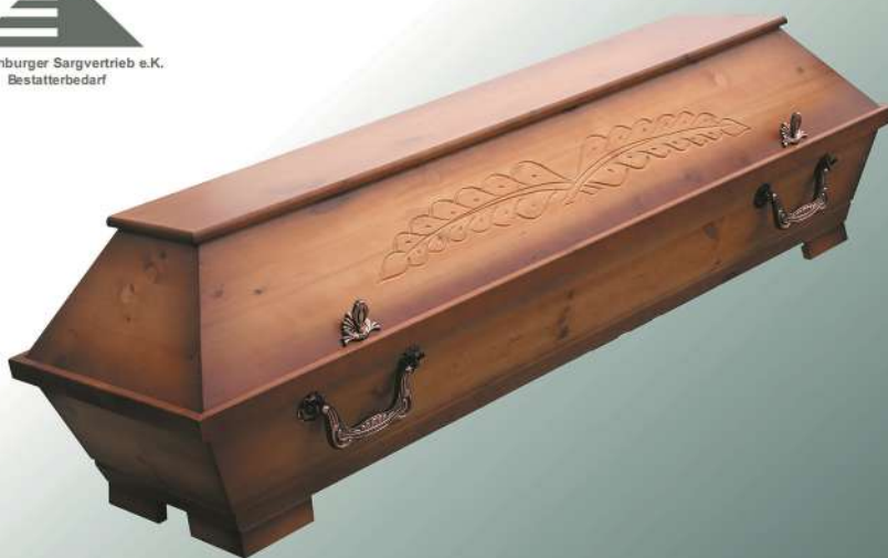
VBK00 Kiefer natur Patina Palme