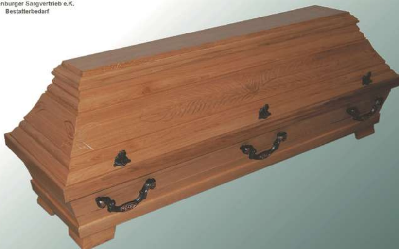
EB8 natur Palme Ecke