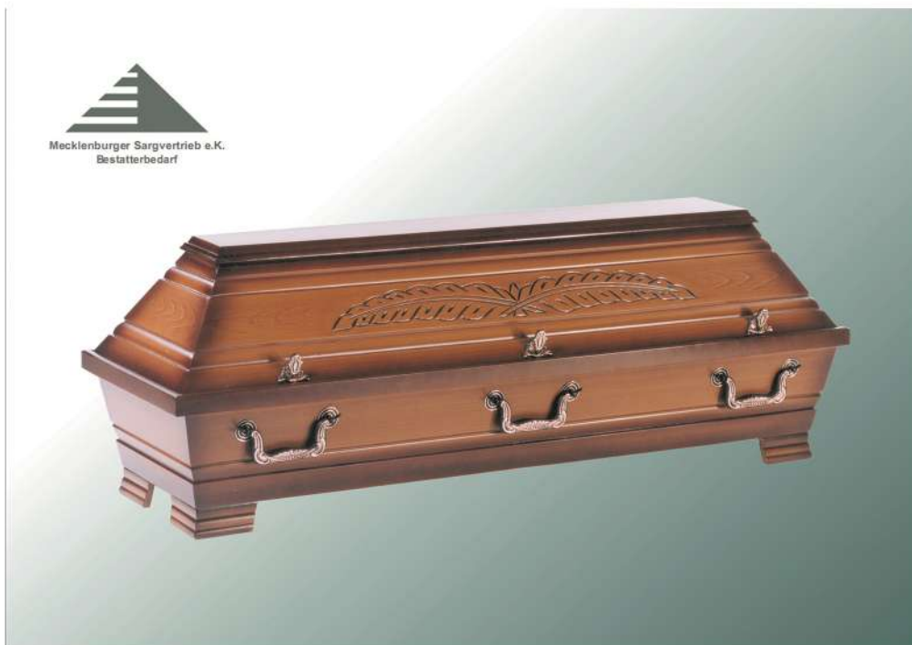
VBK5 mittel altdeutsch Palme