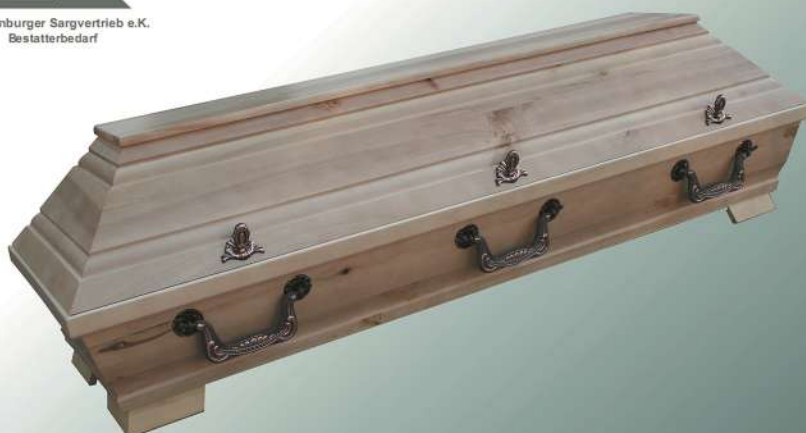
VBK2 Pappel natur ohne Schnitzung