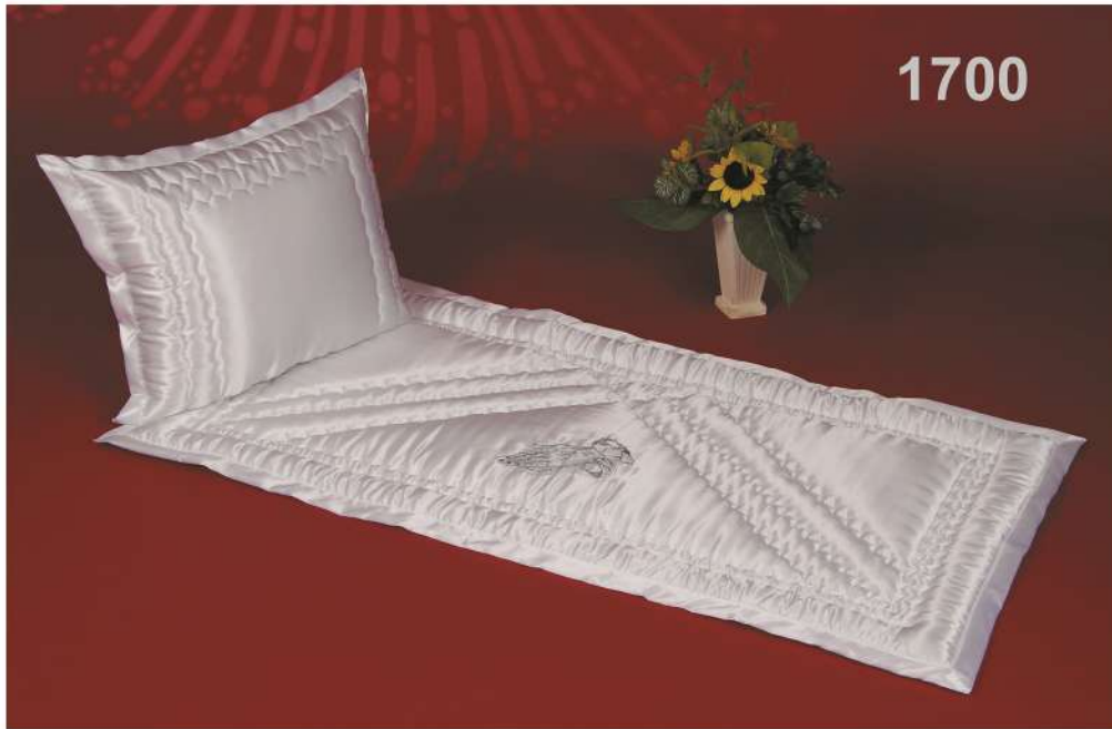
WE-1700-3AV betende Hände