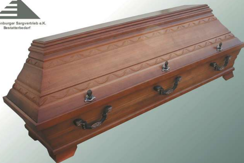
EB4 rustikal altdeutsch

Mecklenburger Sargvertrieb e.K. Bestatterbedarf