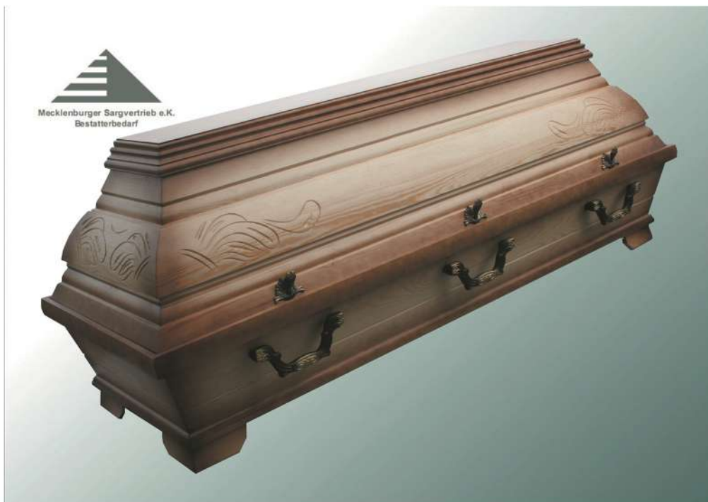
KB3 natur Patina große Wulst Ecke