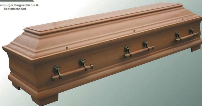
KLG 500 rustikal