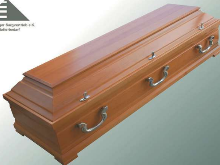
KLG Medea rustikal Griffe Nickel