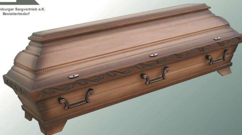
EB52a rustikal altdeutsch