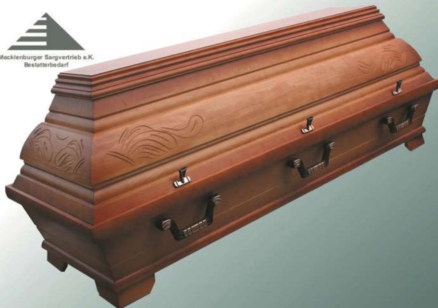
KB3 Bernstein große Wulst Ecke