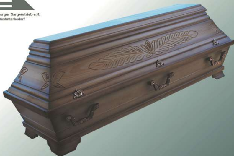
KB8 rustikal antik