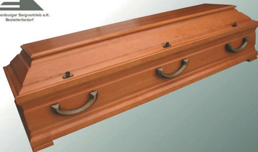
KLG Medea rustikal Griffe halbmond