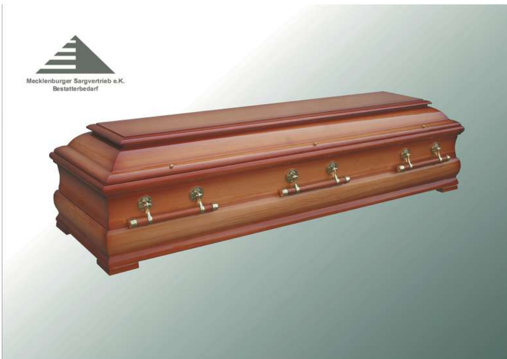
KLG Genius Bernstein hochglanz