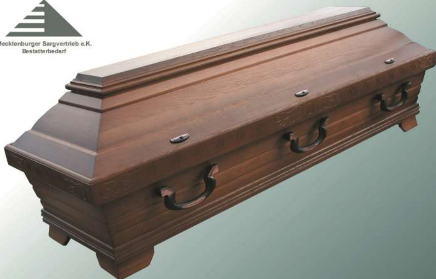
EB451 rustikal altdeutsch