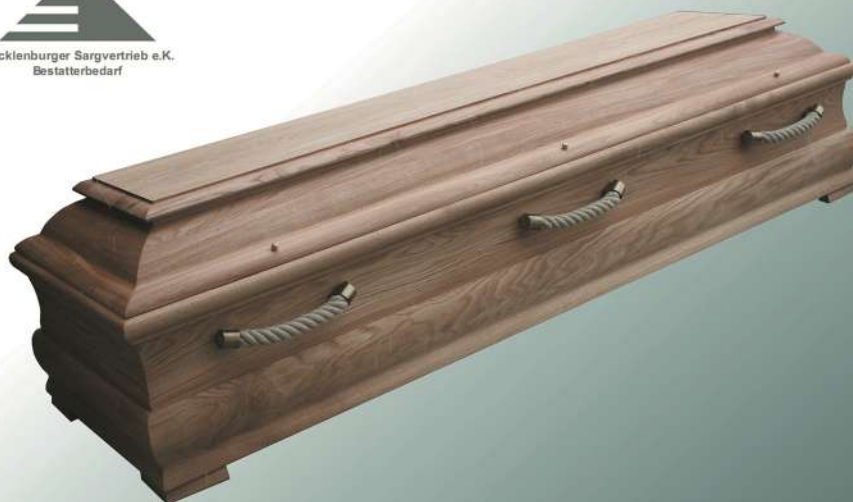
ELG Genius geölt mit Seilgriffen