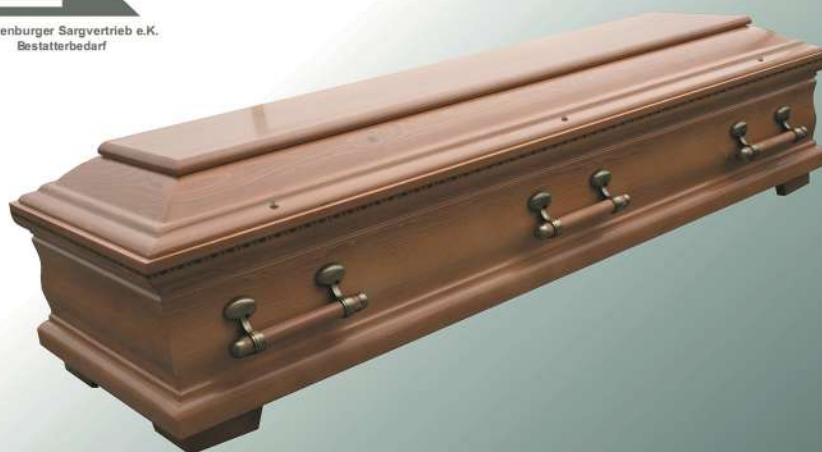
KLG 500 Lux