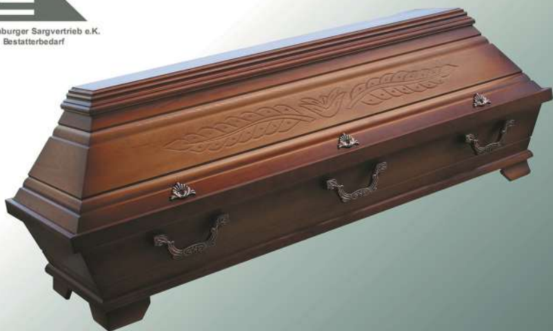
KB2 Palme Bernstein