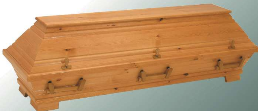
VBK2 rustikal Holzgriffe