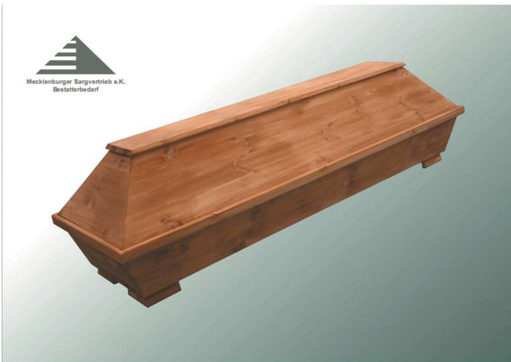
V0 roh gebeizt