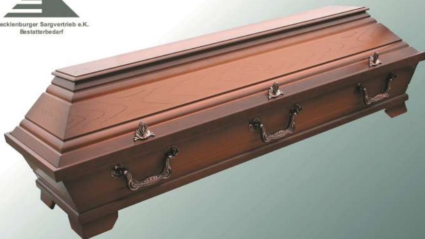
VBK2 mittel altdeutsch