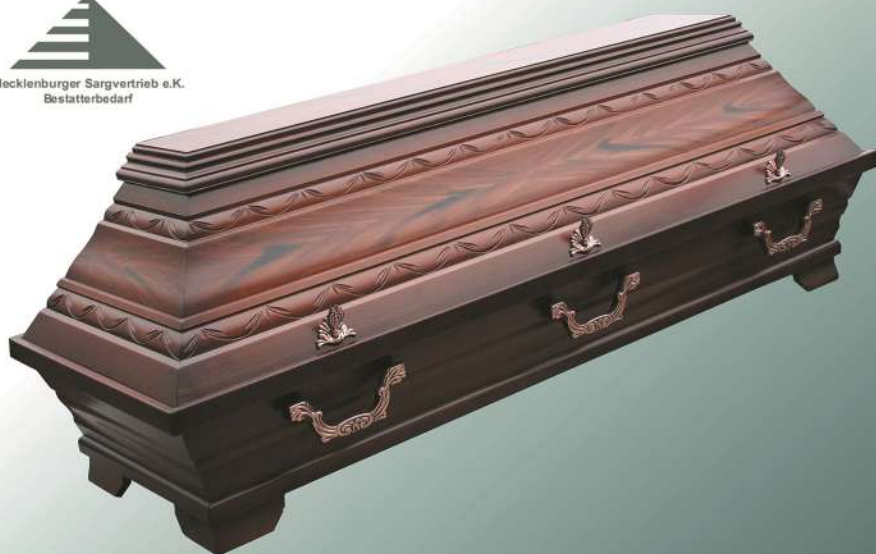
KB4 Nussbaum Imitation Stabschnitzung