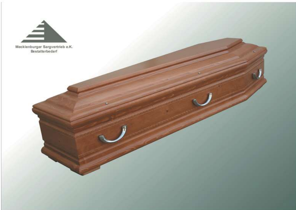
KLG Nr. 100 KF Stabschnitzung