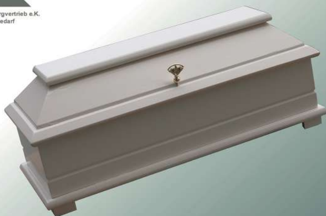
Kindersarg BKW 60 weiß ohne Griffe