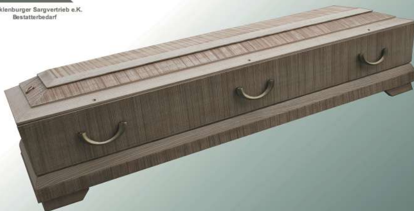
Diritto 92 natur gekälkt