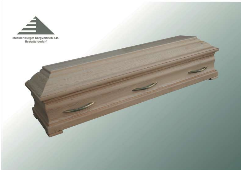
KLG Calabria Kiefer natur