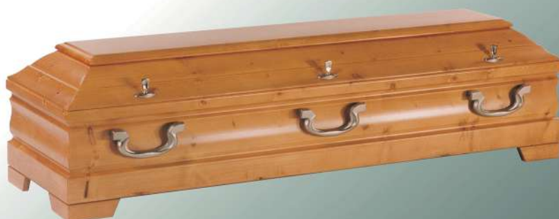
KLG 320 rustikal