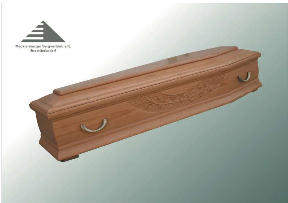
KLG Nr. 66 KF Rosenranke