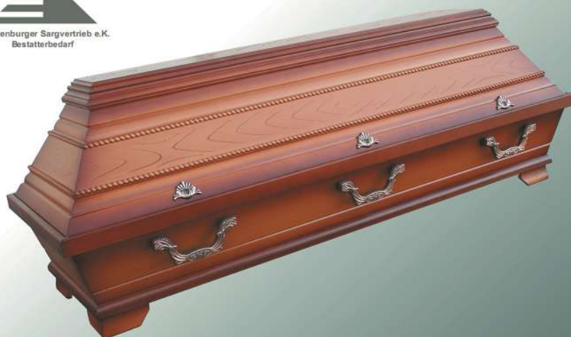
KB1 mittel altdeutsch Perlstab