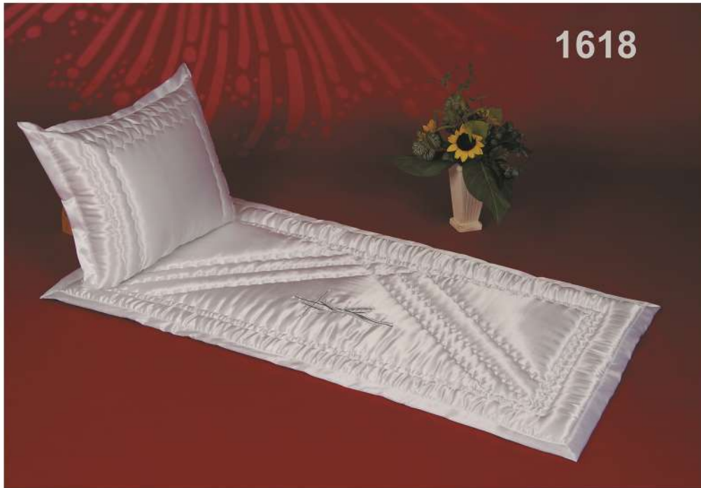
WE-1618-3AV graue Ähre mit Graukreuz