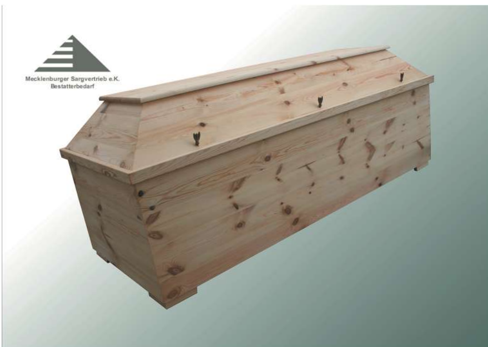
V0 roh geölt XXXL