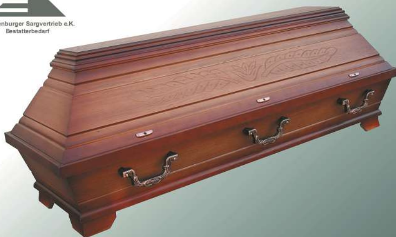
EB34 rustikal altdeutsch