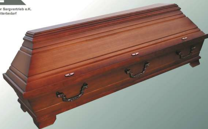
EB33 rustikal altdeutsch