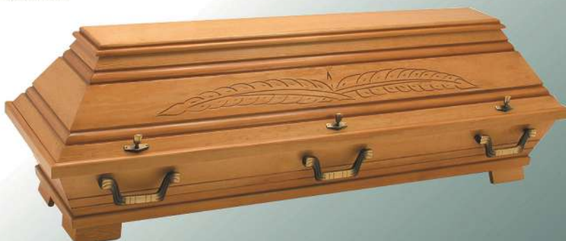
VBK5 Bernstein antik Palme