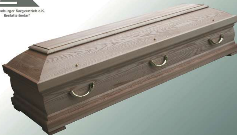
Ravenna Esche geölt