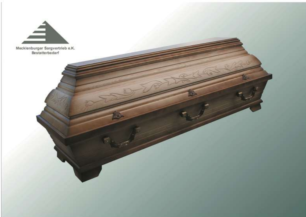
KB3 natur Patina