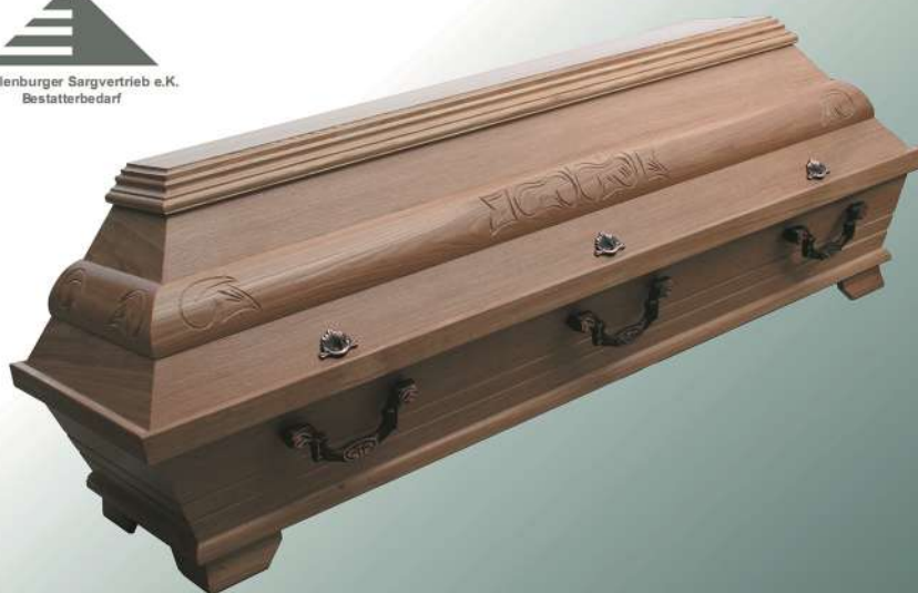
EB3a natur Wulst Schnitzung