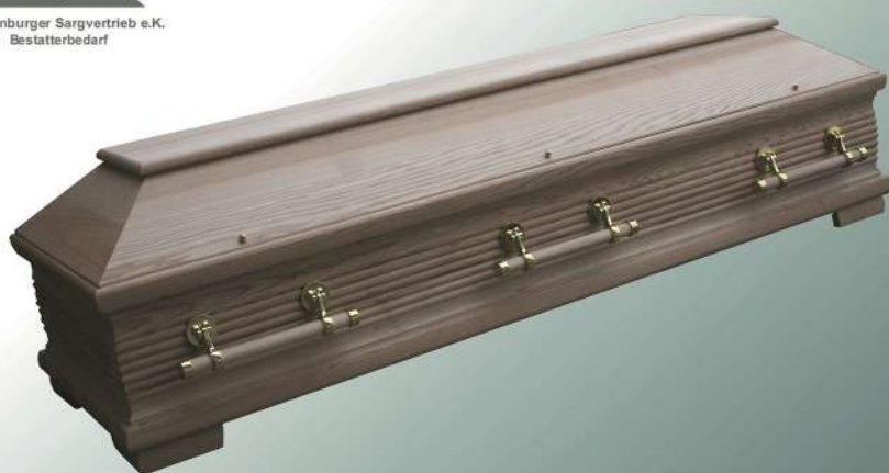
Como Esche geölt