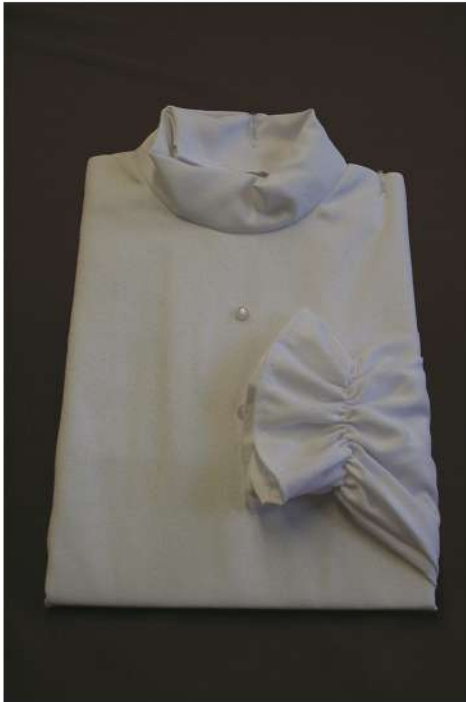
DB 33 XXL