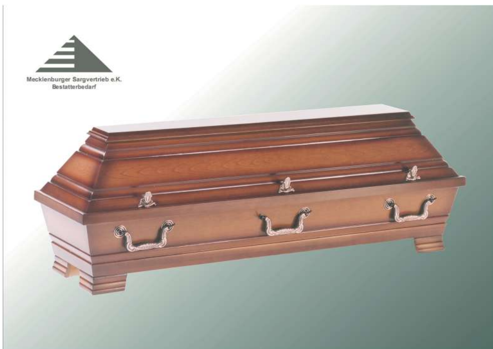
VBK5 mittel altdeutsch