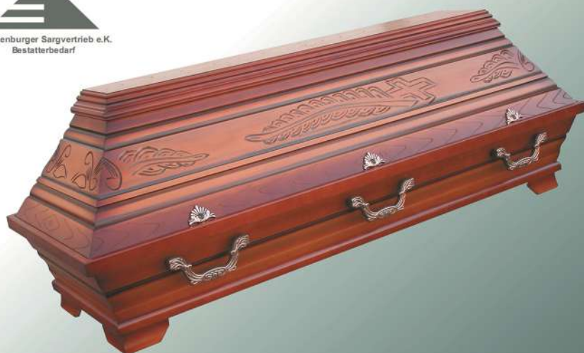
KB2a altdeutsch Kreuz Palme