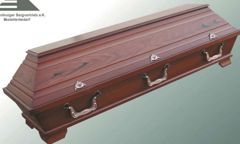
VBK2 Nussbaum Imitation