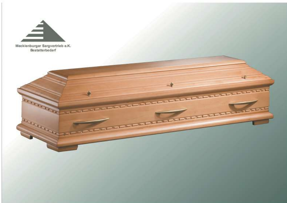
Milano Linde natur