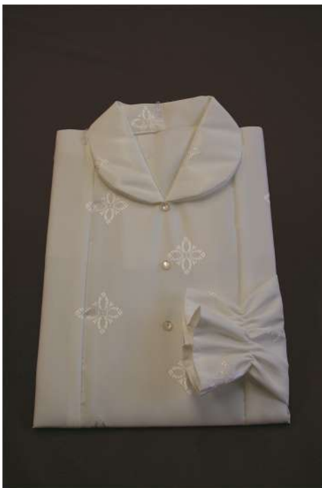
DZ 300 XXL