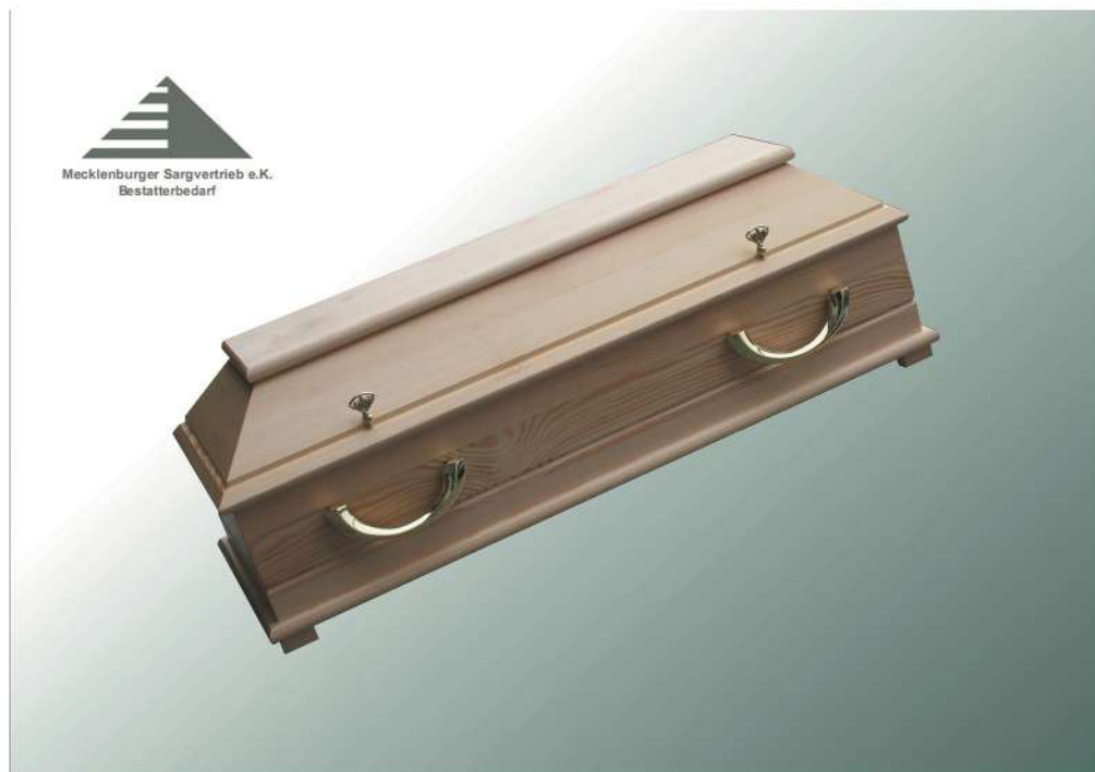
Kindersarg BKW 100 natur mit 4 Griffe