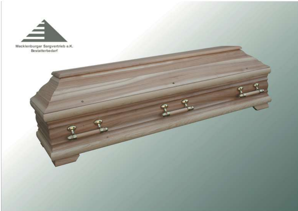
Colonia Esche gewachst