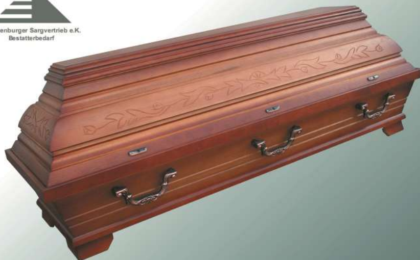
EB2 rustikal altdeutsch