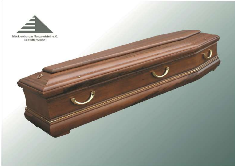
Ambra Nussbaum KF