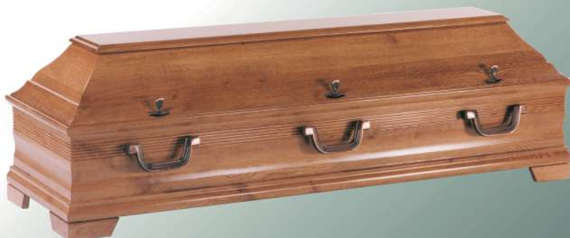
ELG 700 rustikal