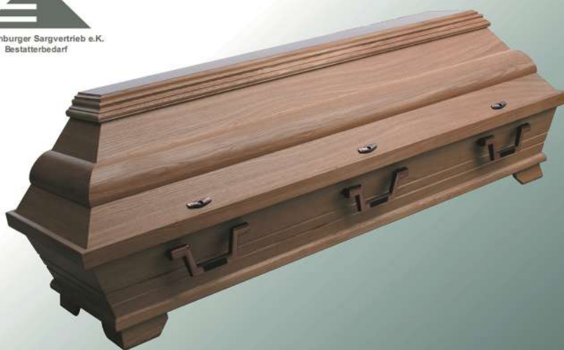
EB3 natur Wulst ohne Schnitzung