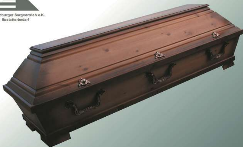
VBK2 rustikal altdeutsch