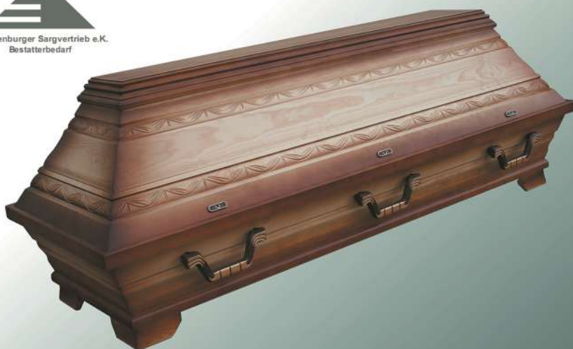
KB4 natur Patina