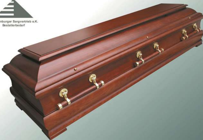
ELG Genius Nussbaum