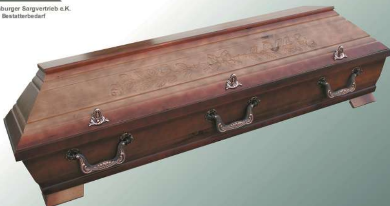
VBK2 Pappel altdeutsch Rose