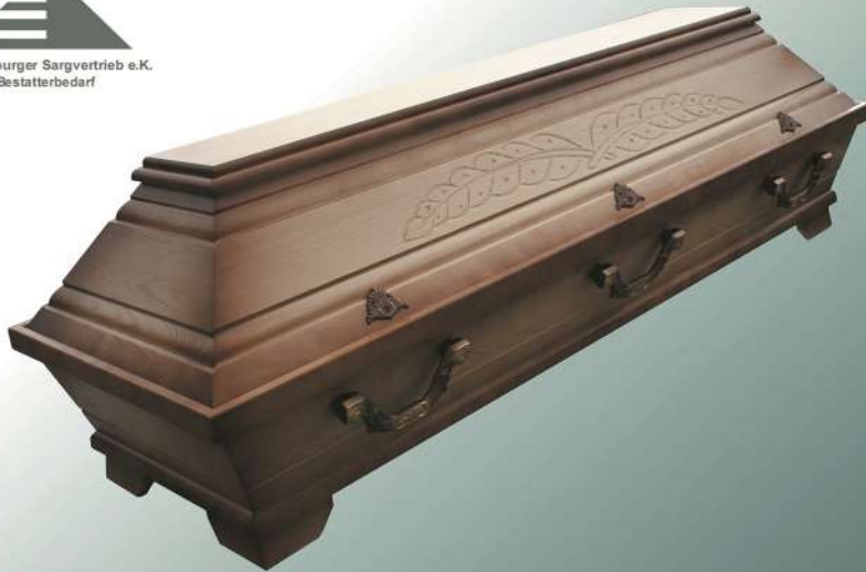
VBK5 natur Patina Palme