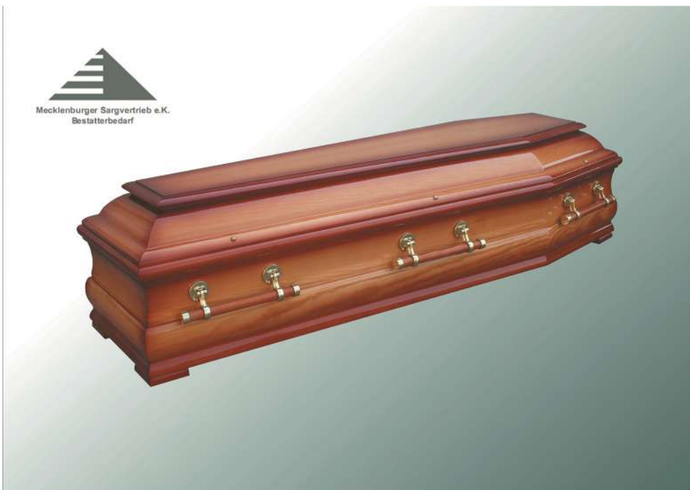
KLG Genius Bernstein Hochglanz KF