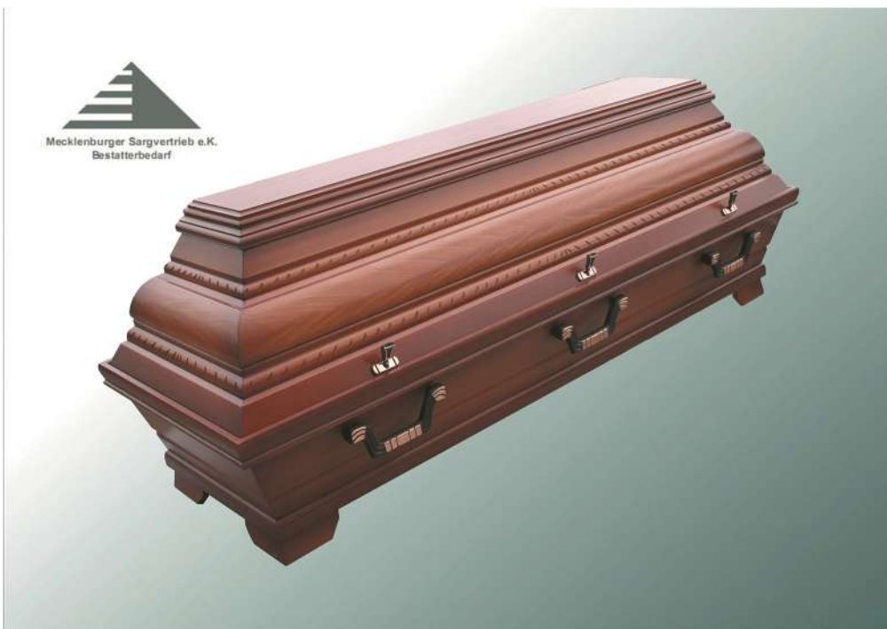
KB7a Kirschbaum Imitation