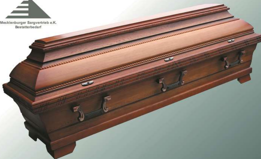
EB52b rustikal altdeutsch

Mecklenburger Sargvertrieb e.K. Bestatterbedarf