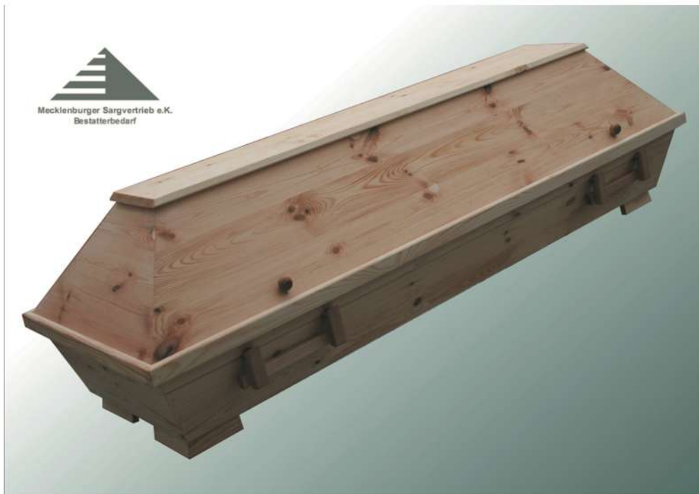
VBK00 astig geölt