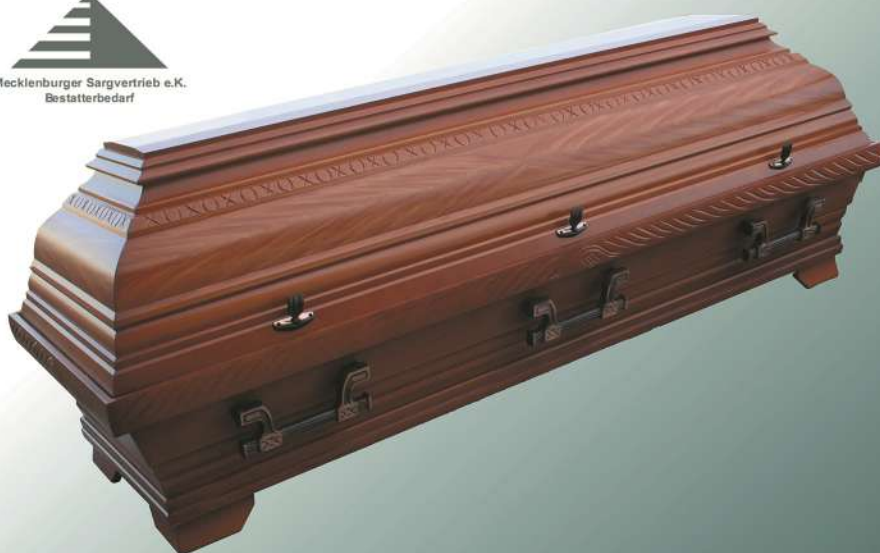
KB151 Kirsche Imitation