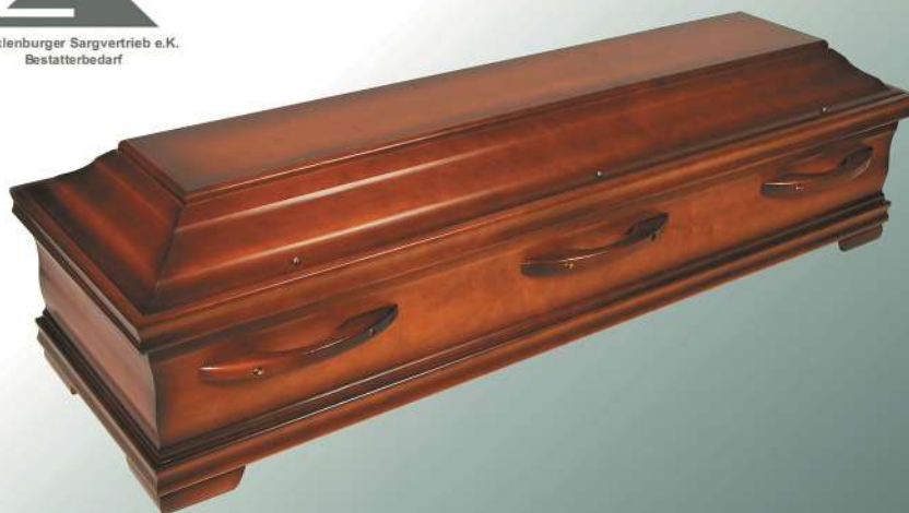
KLG 290 Pappel Nussbaum

Mecklenburger Sargvertrieb e.K. Bestatterbedarf