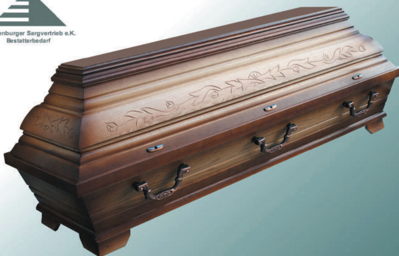
EB2 natur Patina

Mecklenburger Sargvertrieb e.K. Bestatterbedarf