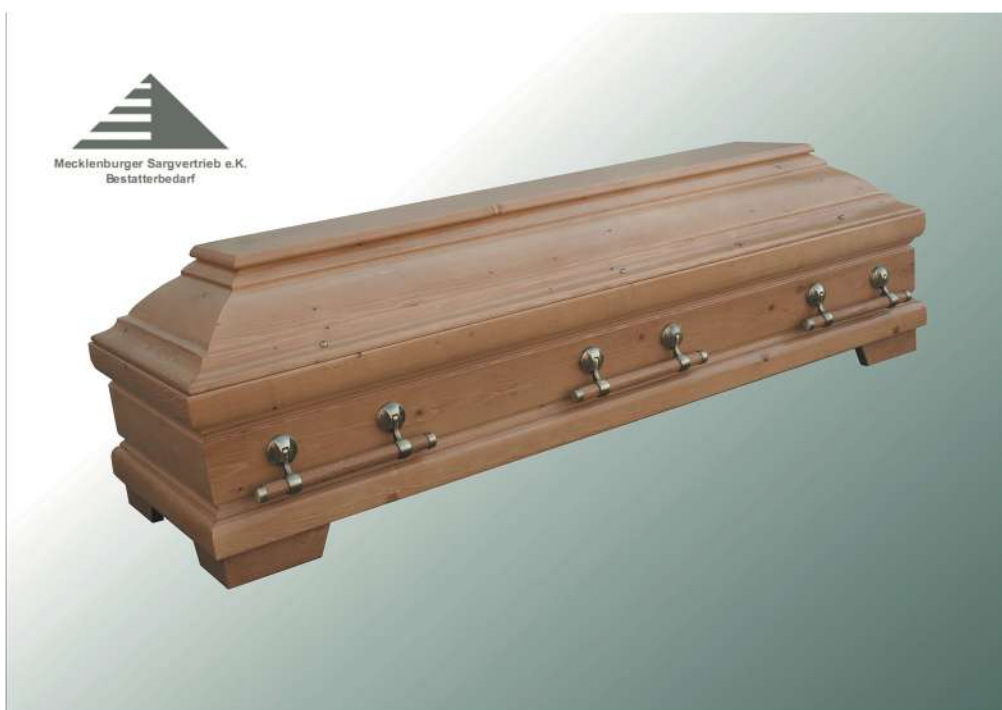
Modell 311 in Tanne lackiert Holzgriffe