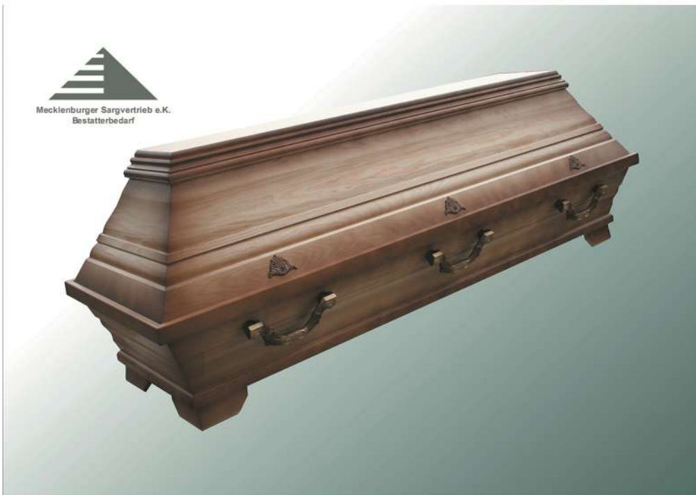
KB8a natur Patina