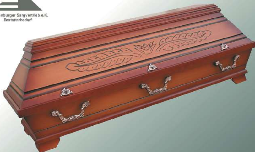
KB2 altdeutsch Palme