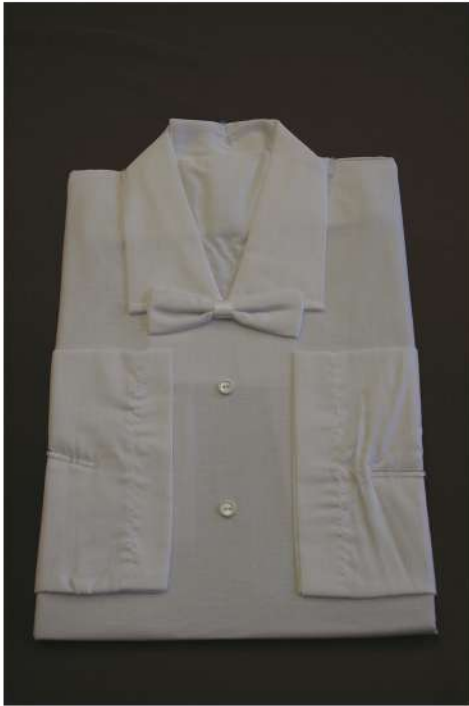
Krema HB XXL