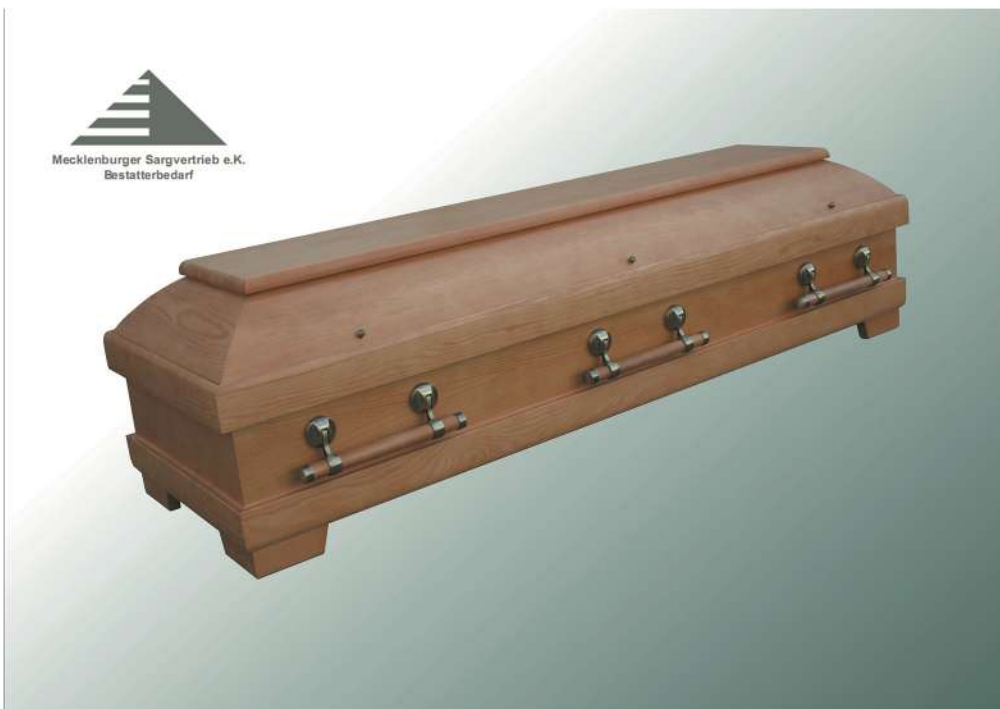
KLG Sirio Tanne