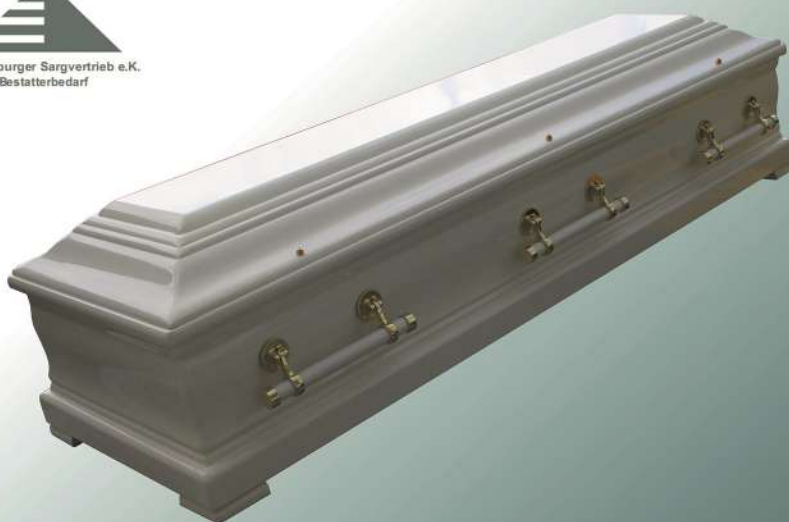
Ceylon Bianca Truhe weiß hochglanz