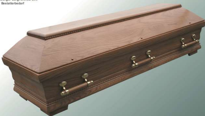
FI Eiche mit Holzgriffen