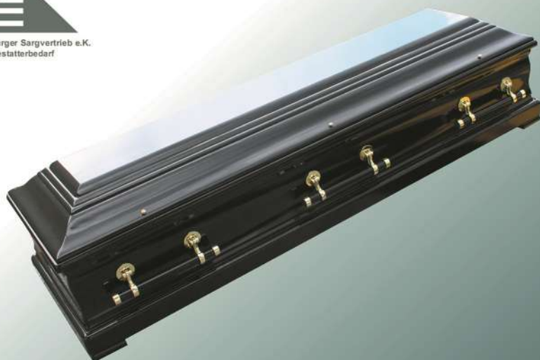
Ceylon Nera Truhe schwarz hochglanz