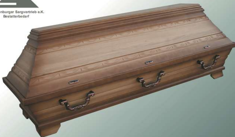
EB4 natur Patina

Mecklenburger Sargvertrieb e.K. Bestatterbedarf