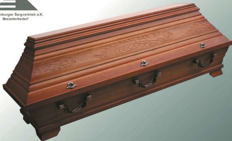
EB2a rustikal altdeutsch