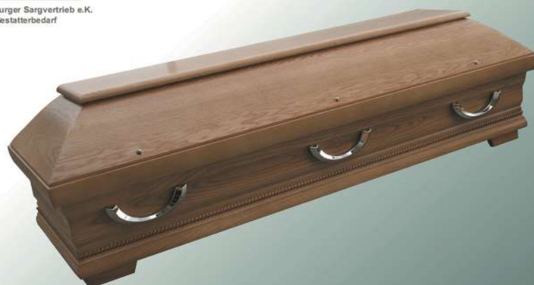
FI Esche natur