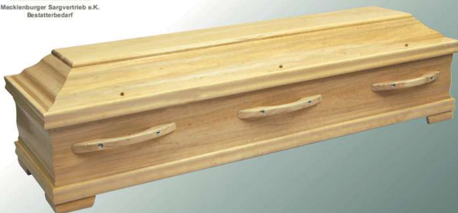
KLG 290 Pappel natur

Mecklenburger Sargvertrieb e.K. Bestatterbedarf