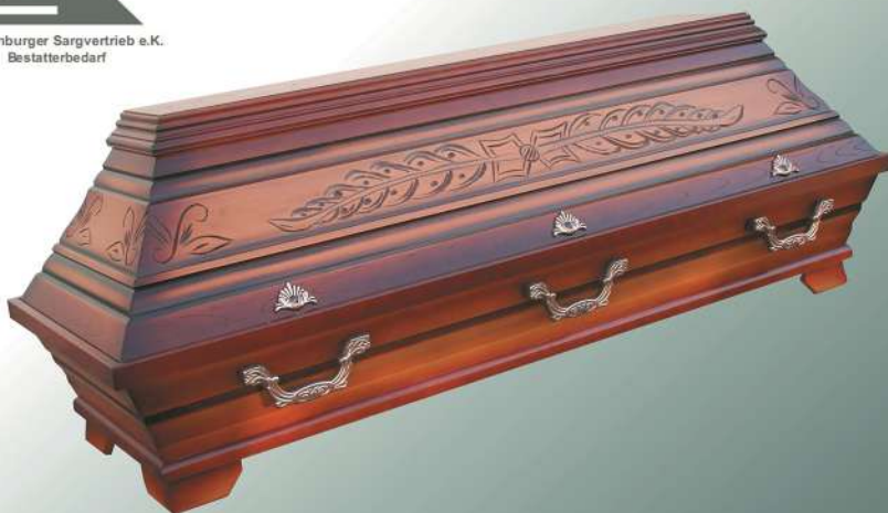
KB8 Palme Ecke altdeutsch