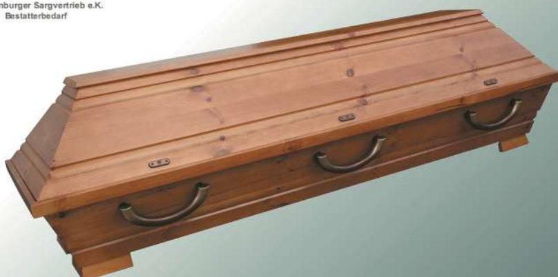
VBK2 rustikal Halbmondgriffe