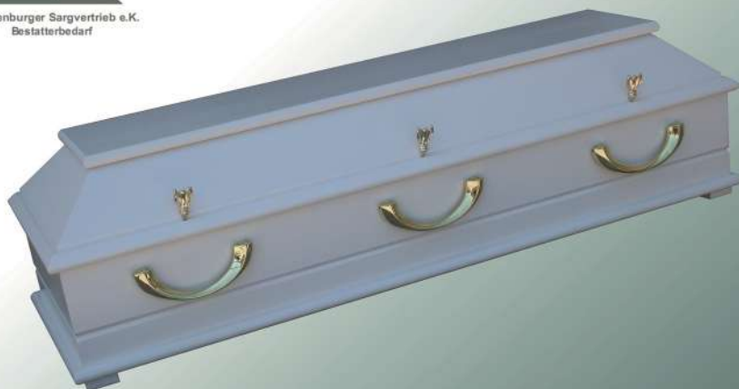
Kindersarg BKW 120 weiß mit 6 Griffe