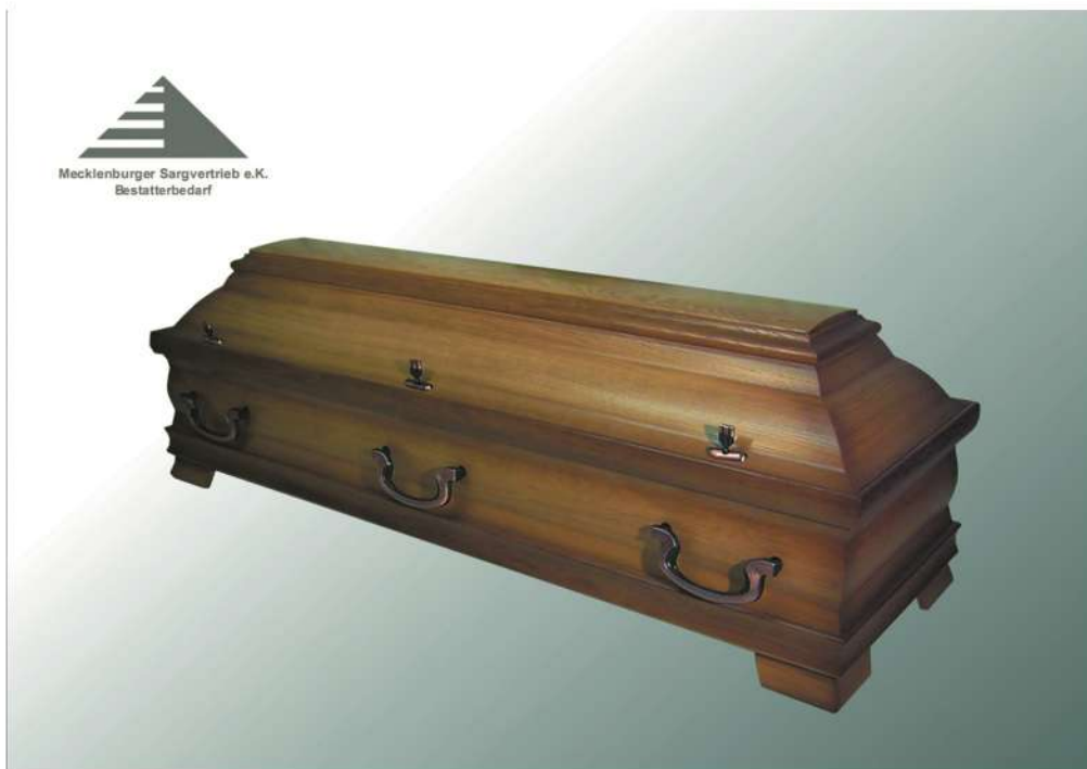
KLG 580 Kiefer Eiche funiert