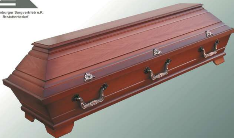
VBK2 Kirschbaum Imitation