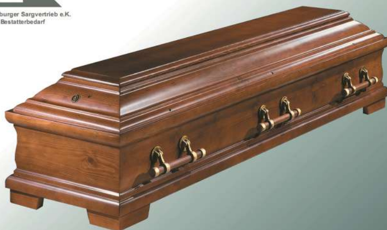
KLG 500 dunkel