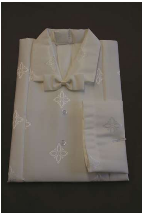
HZ 300 XXL