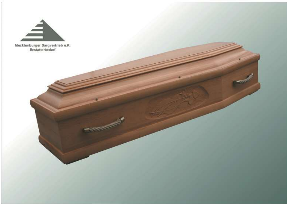
KLG Calla KF