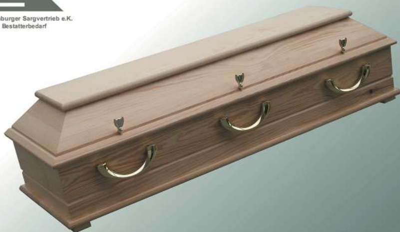
Kindersarg BKW 120 natur mit 6 Griffe